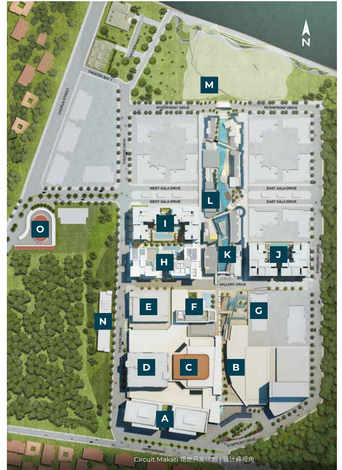
Circuit Makati 场地开发计划 | 设计师视角

这个零售中心占地 10,000 平方米，汇聚了本土和国际品牌，融入了新式餐饮理念，还设有大受欢迎的餐厅和咖啡馆，能够为所有人提供了各式选择。