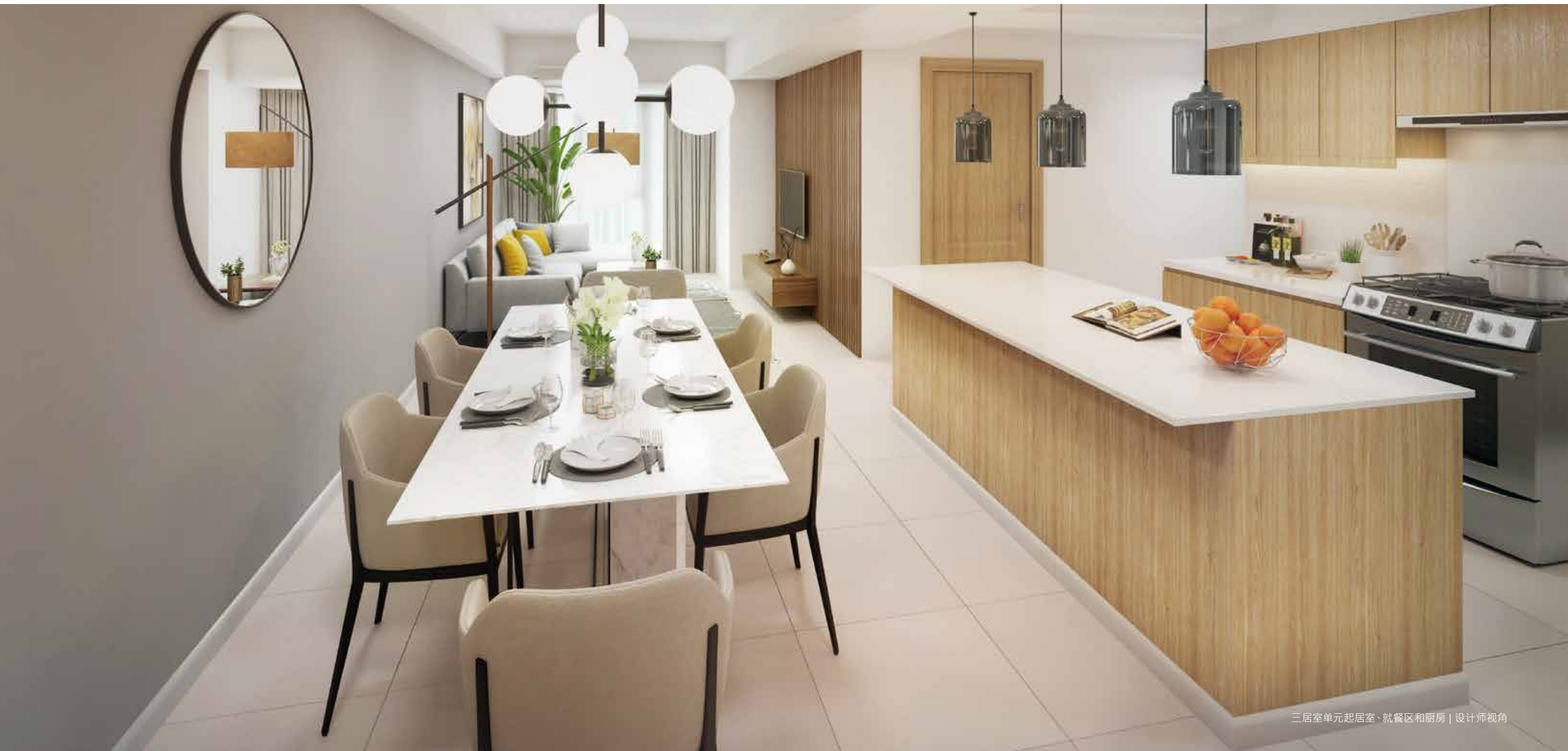
三居室单元起居室、就餐区和厨房 | 设计师视角