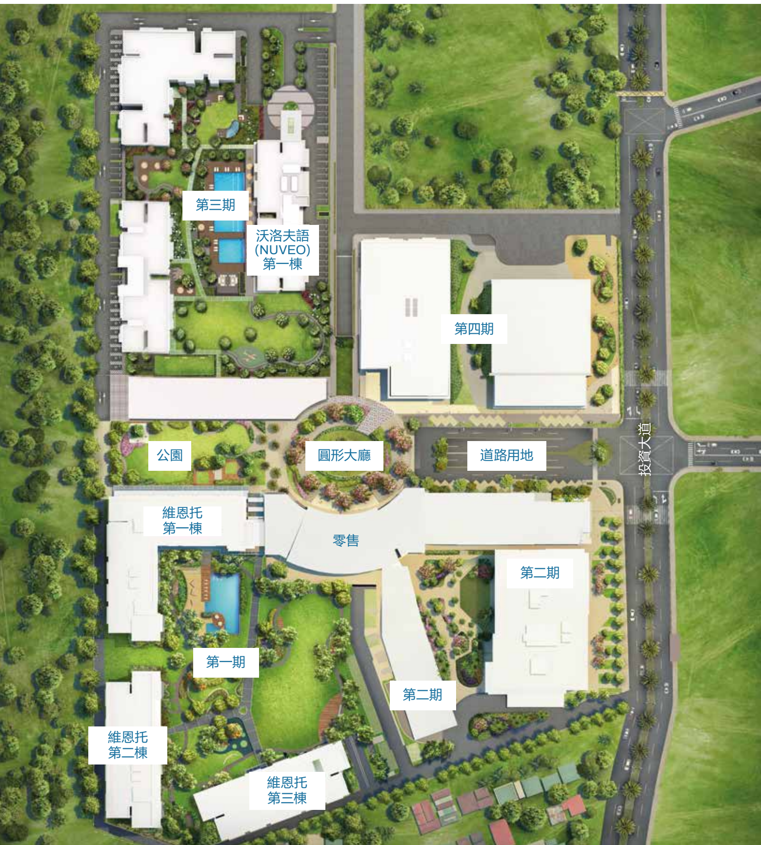
塞爾卡 ( CERCA ) 總平面圖 透視圖